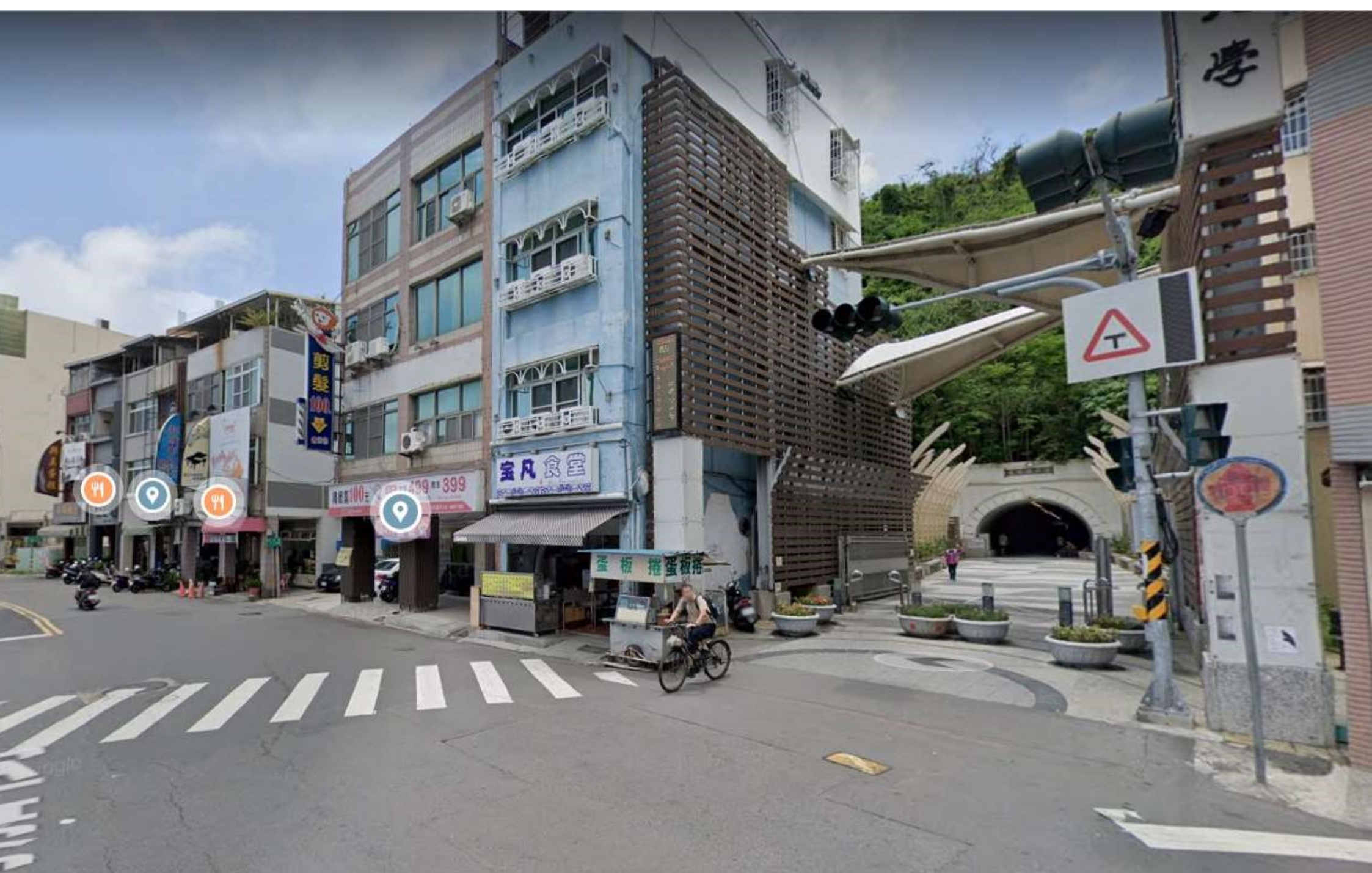
捷運1號出口沿臨海二路，步行500m至中山大學隧道口